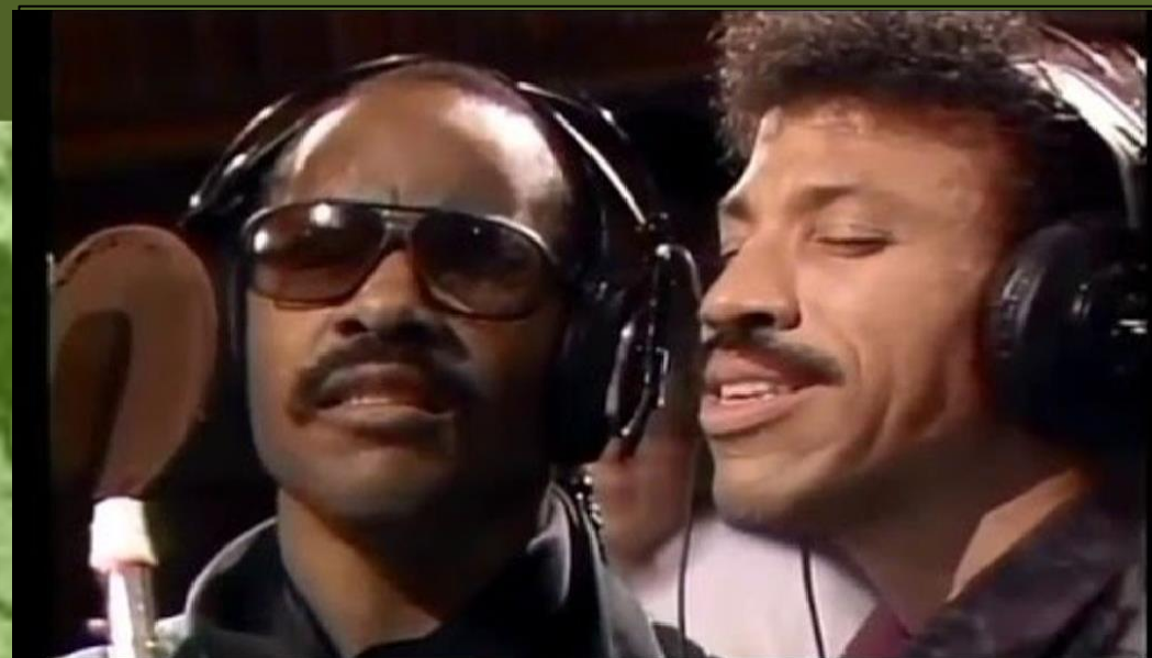
Live Aid 1985 - We Are The World